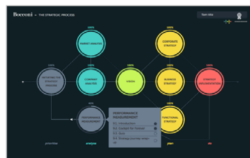
Abbildung 1: Oberfläche der StrategyApp

erarbeiten. Ausgehend von den Möglichkeiten, die die reflect learning suite bietet, wurde zusammen mit dem Design-Team der Strukt GmbH eine innovative interaktive Oberfläche für das Lernprogramm entwickelt.