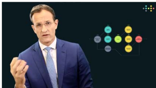
Abbildung 2: Video-Einführung mit Prof. Venzin

Jeder Lerner erhält einen webbasierten Zugang zu seiner persönlichen StrategyApp, einem Lernercockpit, das im Design dem Strategie-Modell von Prof. Venzin gleicht. Über diesen Einstieg öffnen die Lerner die insgesamt 42 Lernbausteine, die sich aus Lernvideos, Quizzes und Übungen, Texten und kollaborativen Aufgaben zusammensetzen.